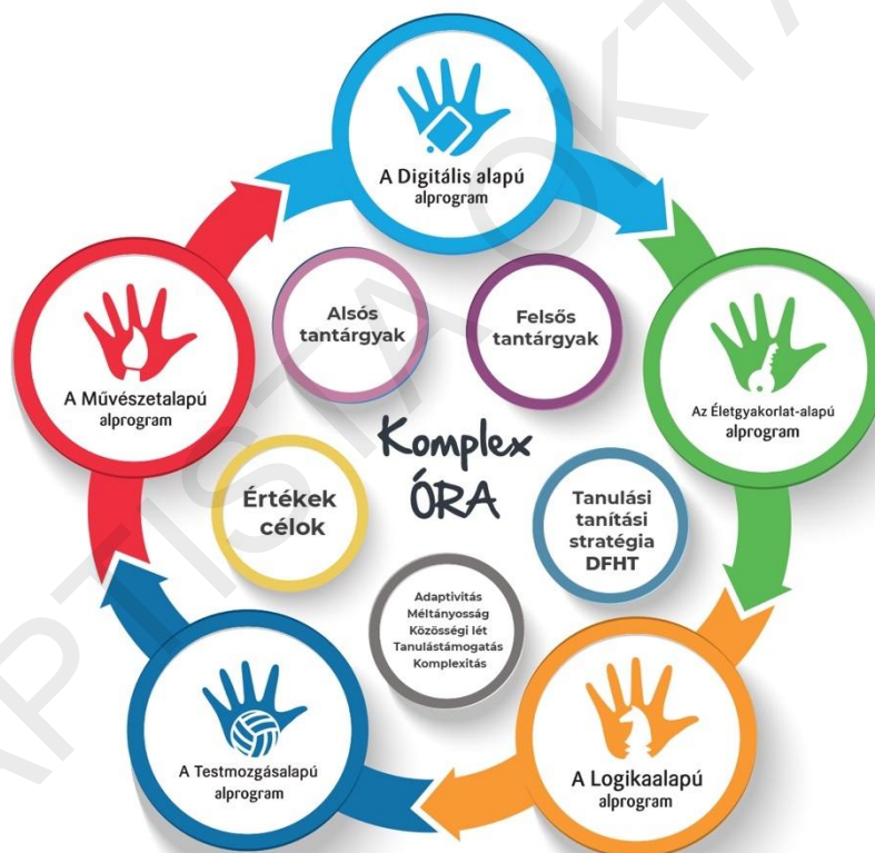
A Komplex órák felépítése